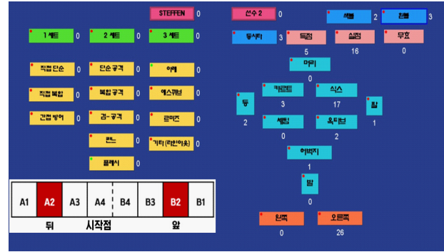
Fig. 2. Fencing analysis code

대상 경기는 2018년부터 2020년까지 진행된 국제대회에서 APITHY(9경기), CURATOLI(9경기), DERSHWITZ(9경기), HARTUNG(9경기), RESHETNIKOV(9경기), KATONA(7경기), KHARLAN(9경기), MARTON(9경기), PUSZTAI(8경기) 총 78경기에서 수집한 1,969개의 득·실점 자료를 바탕으로 연구하였다. 연구대상자들의 신체적인 특성은 <Table 1>과 같다.