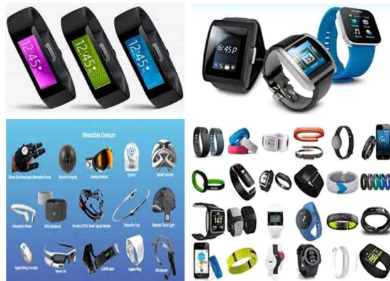
Fig. 2. sports wearable smart device image