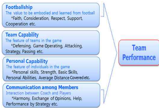
Fig. 2. Concepts of Team performances in football

탐색적요인분석 결과를 토대로 탐색된 축구 팀경기력에 영향을 미치는 네 요인의 명칭을 부여하였다. 요인1은 축구를 하면서 체득되는 동시에 구현해야 하는 가치임을 감안해 축구정신으로, 요인 2는 경기에서 발휘되는 팀의 플레이 특징임을 감안해 팀전력으로, 요인 3은 경기에서 나타나는 선수 개인의 플레이 역량임을 감안해 개인전력으로, 요인 4는 팀에서 선수와 지도자의 상호작용 친밀도임을 감안해 팀구성원소통으로 명명하였다. 이상을 정리하면 축구에서 팀경기력은 팀이 경기에서 발휘하는 경기력으로 축구정신, 팀전력, 개인전력, 팀구성원소통으로 <Fig. 2>와 같이 요약된다.